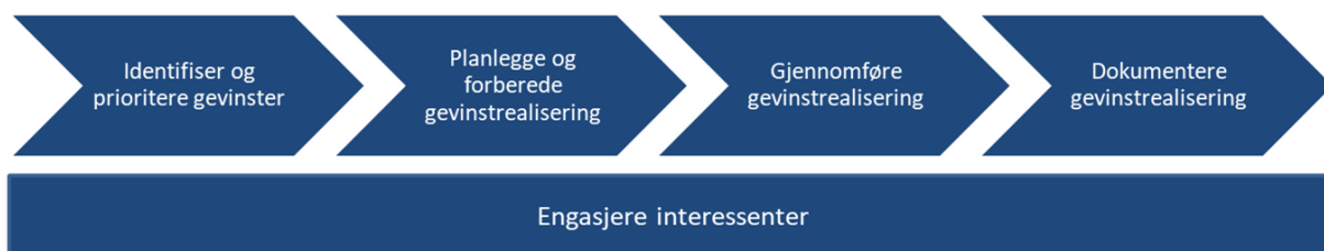
Figur 2: Gevinstrealiseringsprosessen

Prosessen for gevinstrealisering består av fire faser, skissert i figuren under. Disse henger også tett sammen med fasene i innføring av Helseplattformen.